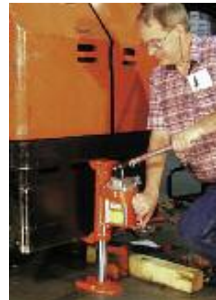
El gato de uña de la serie J es un gato extremadamente robusto utilizado para reparar carretillas elevadoras.